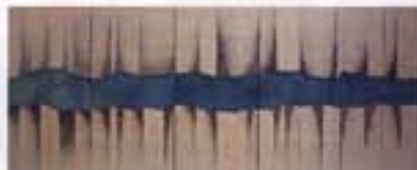
Las firmas del río. 94 x 234 cm.

Av. Xalapa s/n, Xalapa, Veracruz http://www.uv.mx/max/