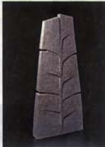
Los senderos del agua. 134 x 70 x 34 cm.

En el marco del Tercer Coloquio Internacional de Escultura en Cerámica, el Museo de Antropología de Xalapa, perteneciente a la Universidad Veracruzana, presenta la exposición "La tierra no es plana" de la escultora en cerámica, Gloria Carrasco.