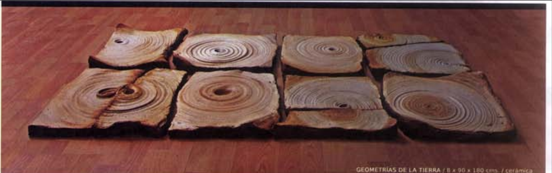
GEOMETRÍAS DE LA TIERRA / 8 x 90 x 180 cms. / cerámica

Este año, los artistas seleccionados dentro "Spotlight Artists" tendrán una exposición individual en un sitio específico dentro la feria de septiembre. Estos artistas fueron seleccionados por Marcela Quiroz Luna, Directora Curatorial quien comenta: "Este año se han seleccionado de todos los latinoamericanos un conjunto de artistas de Brasil y México, incluyendo -por primera vez- el programa "Launchpad" con dos jóvenes y prometedores artistas de Tijuana. Todos los artistas (con no más de 40 años de edad) trabajan en diversos medios. Sus obras transmiten comparten una inherente delicadeza estética que invita a reflexionar sobre las complejas relaciones y las condiciones de fragilidad que construyen nuestra vida cotidiana." SAN DIEGO ART también proporciona un fuerte enfoque en la ciudad y la cultura de San Diego a través de los "Art Labs"; laboratorios de arte con exposiciones una variedad de actividades que van desde el arte del performance, instalaciones multimedia sobre la base del Hilton, conversaciones con especialistas, hasta inauguraciones en cooperación de varias galerías además de actuaciones musicales en diversos lugares. Con "Conversations" la feria brinda numerosos encuentros directos con artistas y líderes en el mundo del arte dando tanto a los aficionados y coleccionistas una experiencia de primera mano sobre los aspectos que involucran al arte actual.