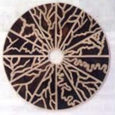
De los cauces. Diámetro 112 cm.

La muestra cuenta con una serie de esculturas e instalaciones inspiradas en las formaciones de la tierra: los ríos, las montañas y los cauces las cuales son abordadas a partir de las sensaciones provocadas por las distintas luminosidades y la fugacidad en lo terrestre. Elementos como el espacio –no en vano, Carrasco cuenta con una de formación de arquitecta–, la abstracción y el movimiento resultan claves en esta exposición y en el trabajo de Carrasco.